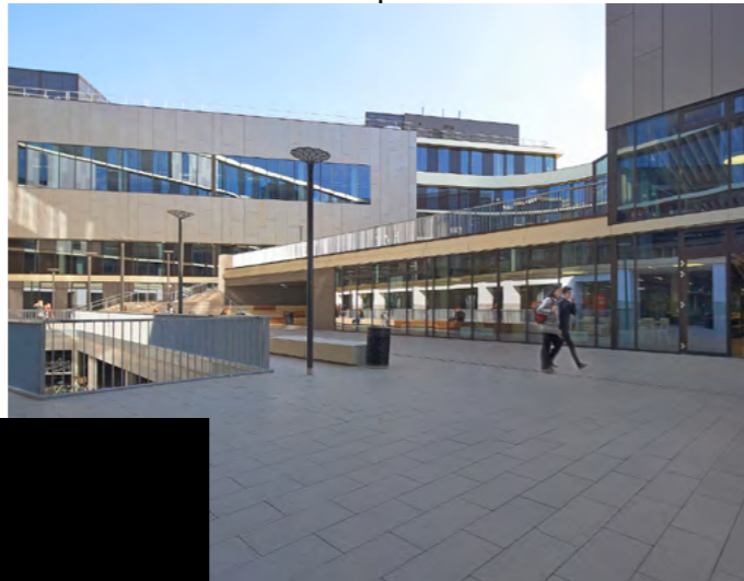
KAREL DE GROTE | Hogeschool Antwerpen

“ Onze schoolomgevingen spelen niet alleen in op de behoeften van vandaag, maar zijn ook klaar voor de uitdagingen van morgen. ”